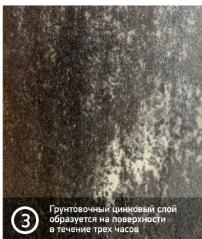
3 Грунтовочный цинковый слой образуется на поверхности в течение трех часов