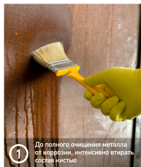
1 До полного очищения металла от коррозии, интенсивно втирать состав кистью