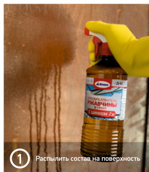
1 Распылить состав на поверхность