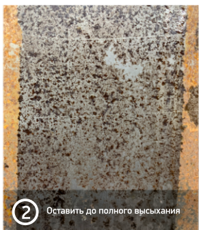
2 Оставить до полного высыхания